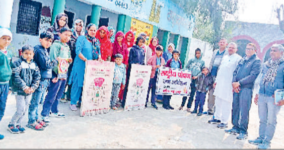
सतनाली। बेटी बचाओ-बेटी पढ़ाओ पर जागरूकता रैली निकालते हुए।