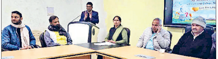
महेंद्रगढ़। विद्यार्थियों को संबोधित करते मुख्यातिथि।