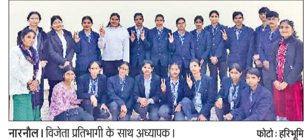
नारनौल। विजेता प्रतिभागी के साथ अध्यापक।