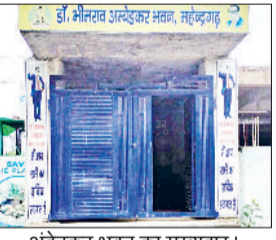
अंबेडकर भवन का मुख्यद्वार।