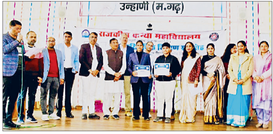
कनीना। मेधावी छात्राओं को सम्मानित करते मुख्य अतिथि व अन्य।