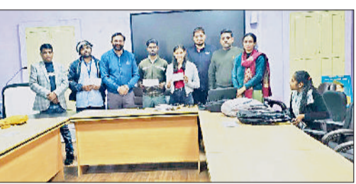
नारनौल। विजेताओं को सम्मानित करते हुए।