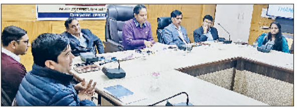
हरिभूमि न्यूज ▶▶ नारनौल

हरियाणा सरकार ने दैनिक दयालु उपायुक्त अन्वयोदय परिवार सुरक्षा योजना दयालु-2 की शुरुआत की है। अब आवारा पशुओं के कारण होने वाली अनहोनी में पीड़ित परिवारों को आर्थिक मदद मिलेगी। इस योजना का लाभ लेने के लिए लाभार्थी का हरियाणा राज्य का निवासी होना अनिवार्य है। लाभार्थी का नाम परिवार पहचान पत्र में दर्ज होना चाहिए। यह योजना तब प्रभावी होगी, जब पशु हमले का हादसा हरियाणा राज्य की सीमा के