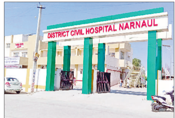
नारनौल। ट्रॉमा सेंटर, जहां कैंसर पीड़ितों के लिए डे केयर सेंटर स्थापित होना है।

रोहतक, जयपुर या एम्स जैसे बड़े संस्थानों के नहीं काटने पड़ेंगे चक्कर राजकुमार ▶▶ नारनौल