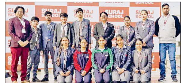
महेंद्रगढ़। खुशी जाहिर करते विद्यार्थी।